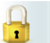
Changer mot de passe

Si vous souhaitez changer de mot de passe vous pouvez passer par l'icône de cadenas à gauche.